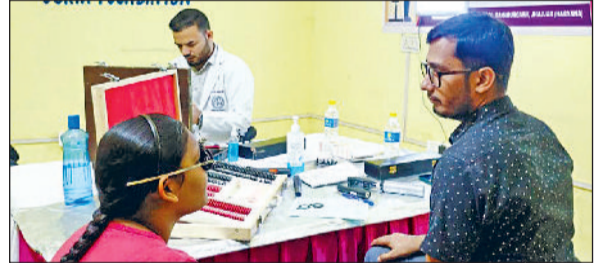
बहादुरगढ़। सांखोल में ग्रामीणों की आंखें जांचते चिकित्सक।