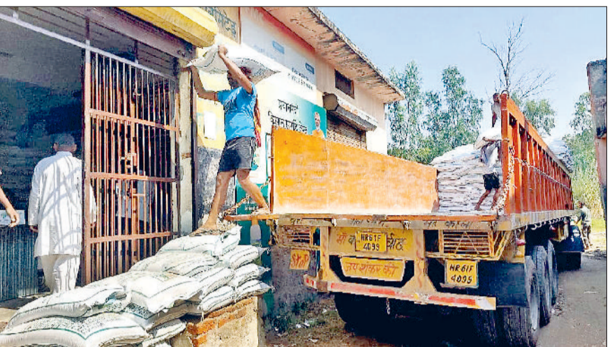
झज्जर। केंद्र पर आए गेहूं के बीज को उतारते हुए श्रमिक।