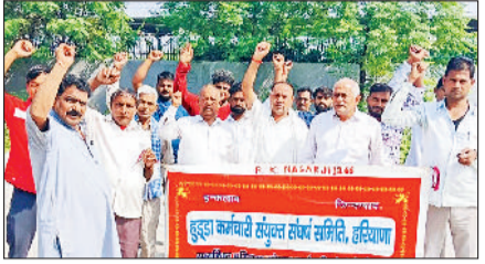
बहादुरगढ़। मांगों को लेकर नारेबाजी करते कर्मचारी।