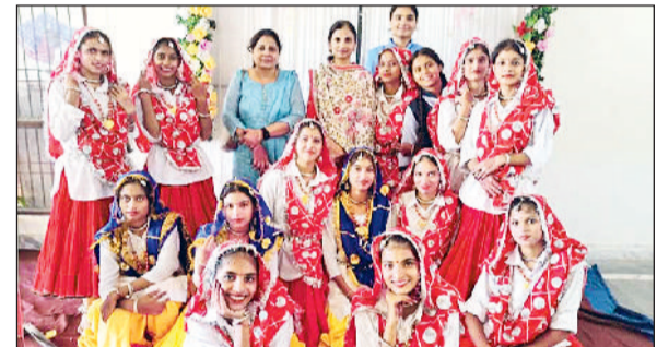
बहादुरगढ़। प्रथम स्थान प्राप्त करने वाली नूना माजरा स्कूल की छात्राएं।

जिलास्तरीय कल्चरल फेस्ट में दिखाई प्रतिभा