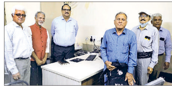
बहादुरगढ़। एडिशनल डायरेक्टर से मुलाकात करते प्रतिनिधिमंडल सदस्य।

बहुत खराब श्रेणी में होने पर दूसरा चरण, 401 से 450 के बीच गंभीर श्रेणी में होने पर तीसरा चरण और 450 से अधिक अत्यधिक गंभीर श्रेणी में होने पर चौथा चरण लागू किया जाता है। बढ़ते प्रदूषण के कारण आंखों में जलन और पानी गिरने की समस्या भी बढ़ने लगी है। टूटी सड़कों पर उड़ती धूल और निर्माण गतिविधियां शहर की हवा को खराब कर रही हैं।