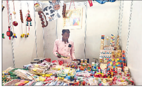
बहादुरगढ़। एचएल सिटी में लगी प्रदर्शनी में अपने उत्पाद दिखाते शिल्पकार।